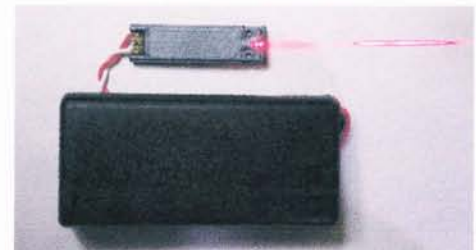
B: レーザーポインター